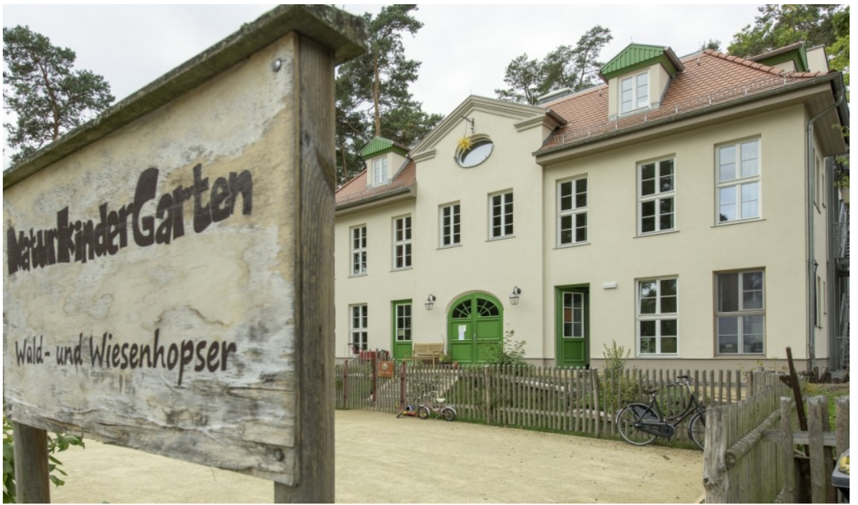
Naturkindergarten in Bad Saarow